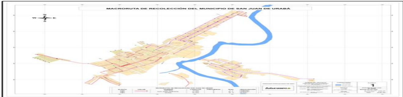
MICRORUTAS DE RECOLECCIÓN SAN JUAN DE URABÁ