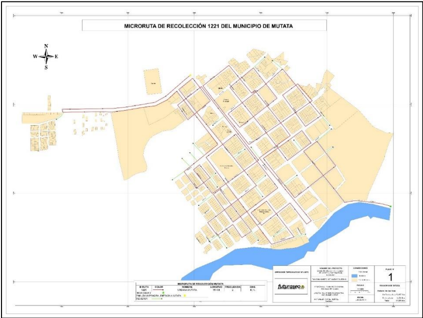
ruta D e recolección MUTATÁ-ZONA URBANA-1221