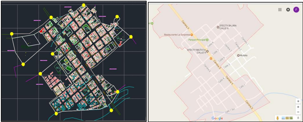
PLANO MANZANERO MUNICIPIO DE MUTATÁ